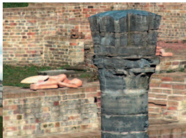
Mimmo Paladino verspreidde zijn werken in de ruïnes van de Koksijde Duinenabdij.