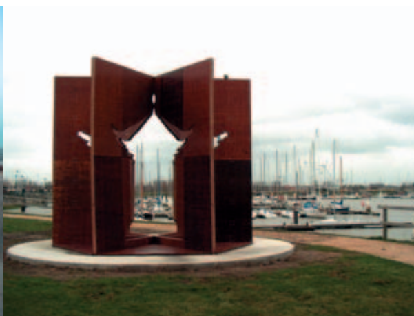
Aan de Nieuwpoortse Yachthaven pootte de Chinese kunstenaar Ai Wei Wei deze "Portable Temple" neer.