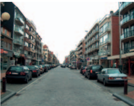
De Ronde van Vlaanderen winnen is makkelijker dan een Nieuwpoortse parkeerplaatsje bemachtigen. Tenzij u Tom Boonen heet, natuurlijk.