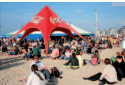
Sfeer, muziek en zand in uw pistolé: Dranouter-aan-zee!

MEER INFO: Toerisme De Panne, Zeelaan 21, De Panne. Tel. 058 42 18 18. Web www.depanne.be .